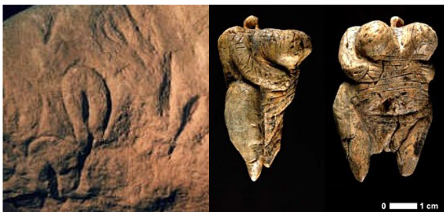
Abri Cellier (Dordogne)

Avant le Gravettien, dans la culture de l' Aurignacien (environ 40.000 à 28.000 ans avant J.C.) l'évocation des formes féminines, en dehors des vulves gravées dans la pierre (ex. Abri Cellier), restent exceptionnelles, comme à Hohle Fels et Galgenberg.