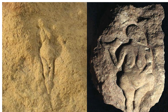
Abri Pataud (Dordogne)