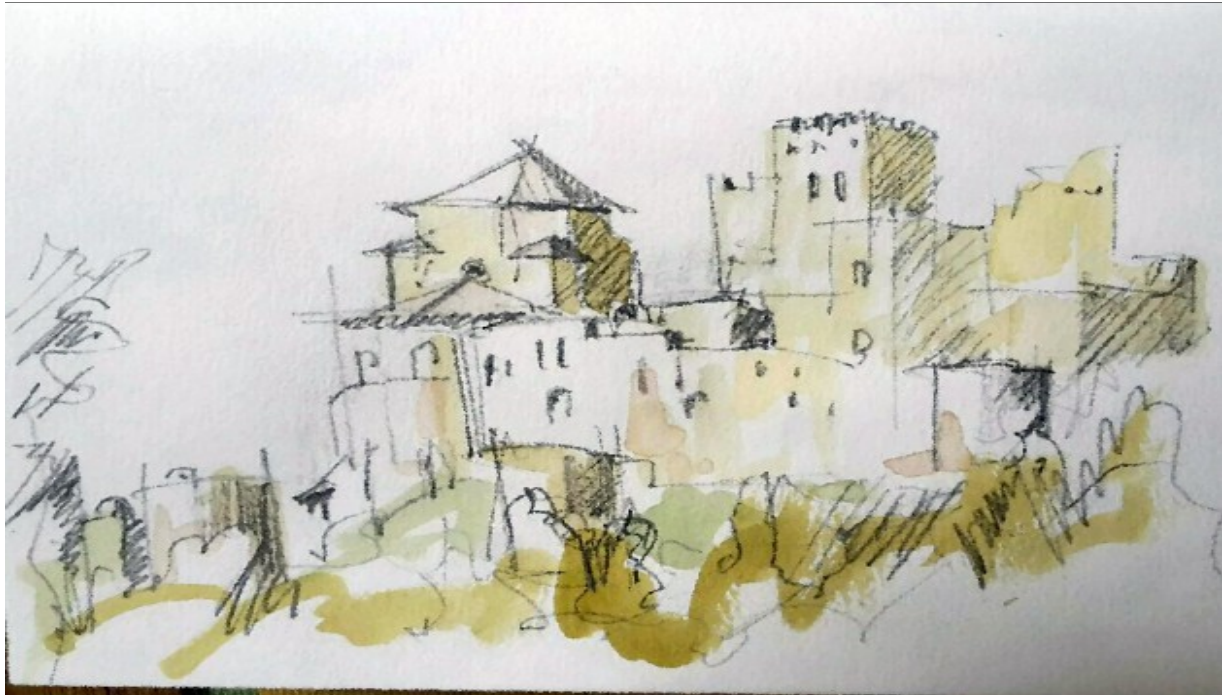
Le château de Loarre «croqué sur le moment», aquarelle d'Hervé Chambron, bravo et merci l'artiste.

Pendant cette journée le beau temps a été de tous les instants pour accompagner les 27 participants, qui pour nombre d'entre eux ont découvert un site de toute beauté avec le château-forteresse-monastère de Loarre posé à la manière d'un « nid d'aigle ». Après son histoire retracée par une séance audiovisuelle, direction la visite guidée « in situ ». Cette visite terminée nous descendons au village de Loarre pour découvrir l'église San Esteban. Les estomacs se réveillent, mais il faudra aller jusqu'à Riglos pour défier du regard les imposants mallos puis s'installer enfin sur la terrasse de la « Casa Roseta » pour laisser libre cours aux appétits de chacune et de chacun.