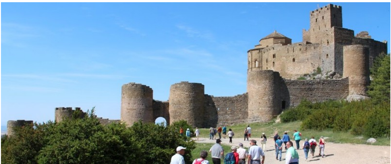
Le groupe à l'assaut de la forteresse de Loarre.....

Avant de prendre le chemin du retour nous rejoignons la place du village d'Agüero et le porche de l'église pour découvrir son renommé tympan. Proche des 18h il est temps de penser au retour.