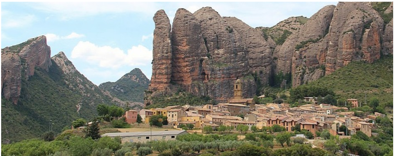
le village d'Agüero

Les trois pages suivantes vous donnent un petit résumé et quelques explications sur les lieux et les monuments que nous avons pu voir, et nous espérons que cela vous donnera l'envie d'en découvrir plus.