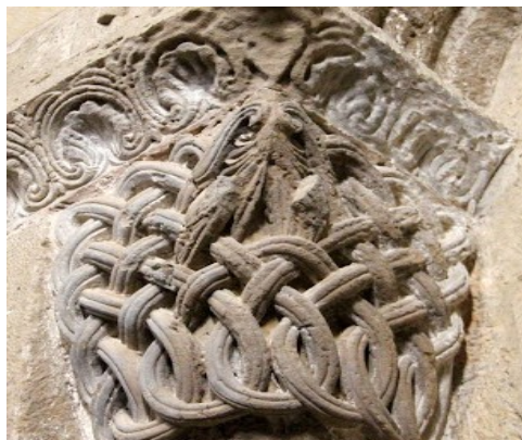
Deux des 82 chapiteaux.