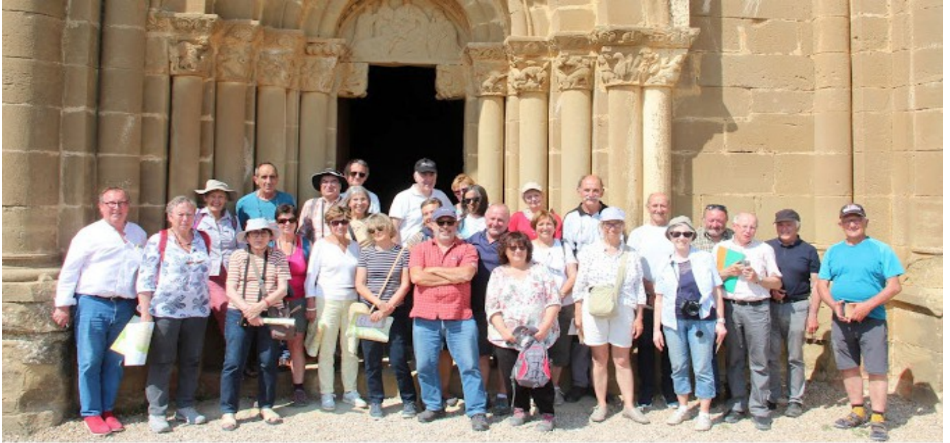
Le groupe ( tout le monde se reconnaîtra) devant l'entrée de l'église Santiago.