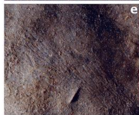
Fig. 2. Wall engravings in the Saint-Michel cave (Arudy, Pyrénées-Atlantiques).

L'article publié dans INORA sous le n°89 en 2021 a été cosigné par : Diego Garate, Olivia Rivero, Inaki Intxaurbe, Sergio Salazar, Jean-Marc Pétilion et Patricia Desmonts