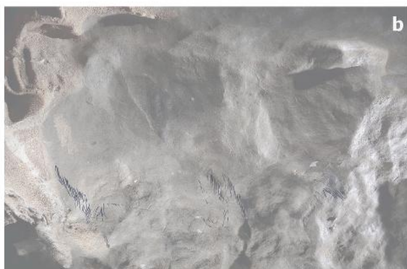
Fig. 2. Vestiges gravés sur la paroi dans la grotte de Saint-Michel (Arudy, Pyrénées-Atlantiques).