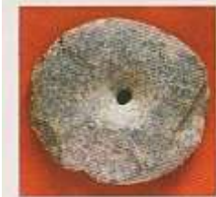
› Fig. 45 - Galet discoïde à perforation centrale bi-conique.