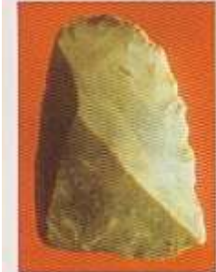
› Fig. 44 - Grattoir, en silex, du Néolithique.