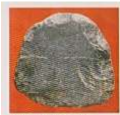
› Fig. 43 - Le palet disque, en quartzite, du Néolithique.