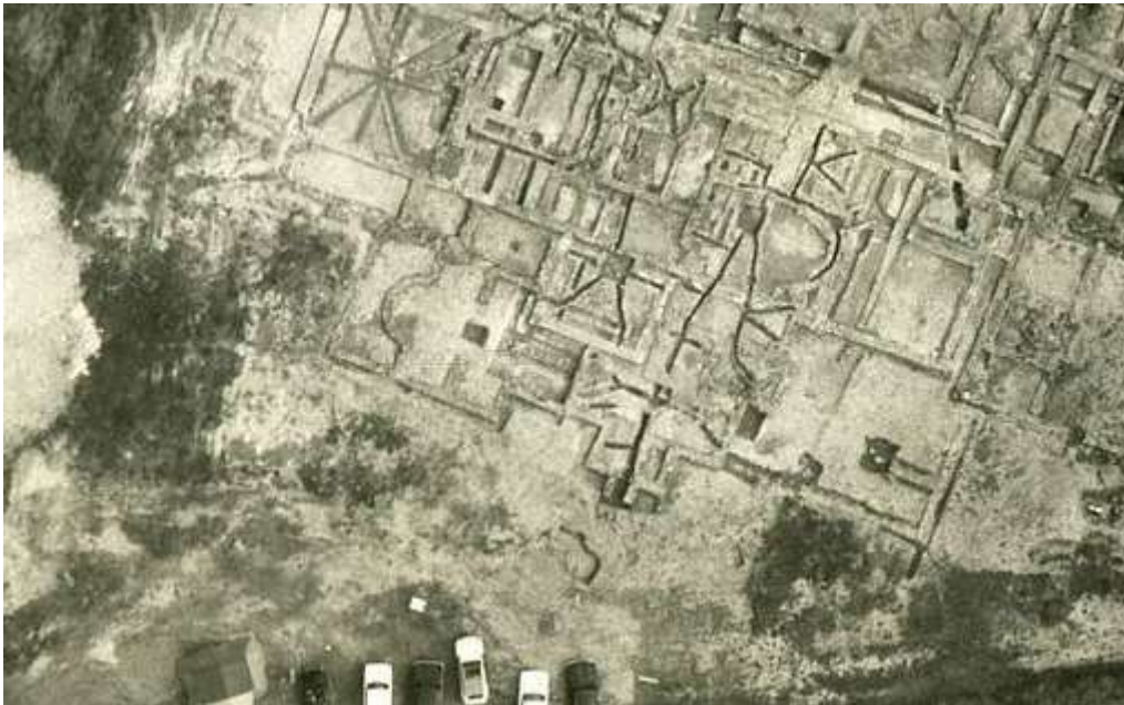
Photo aérienne du site, présentée au musée. On peut y reconnaître les divers éléments de cet ensemble remarquable