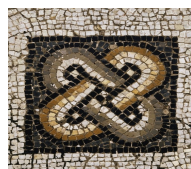
A gauche, le noeud de Salomon.

Un atelier itinérant de mosaïstes est certainement passé par Bielle.